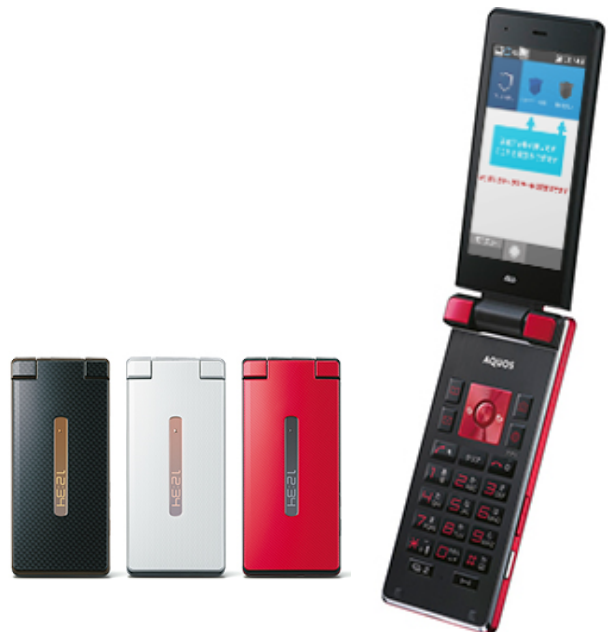
4G LTE ケータイ「AQUOS K」

※2 端末のボタン上部を指でなぞることにより画面上のカーソルを動かしてマウスのように操作できる機能です。