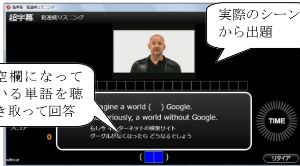
< 出題画面 >