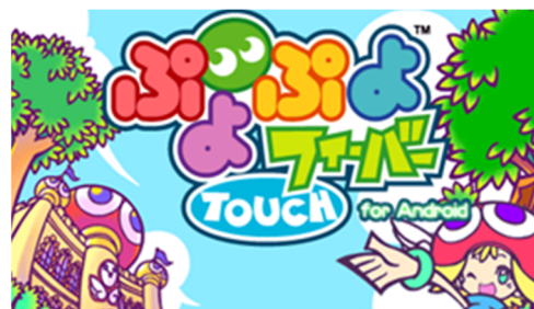
ふよふよフィーバーtouch